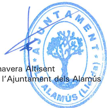
Celestí Panavera Altisent Alcalde de l'Ajuntament dels Alamús