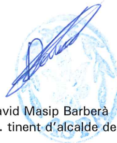
David Masip Barberà 1r. tinent d'alcalde de l'Ajuntament d'Aspa